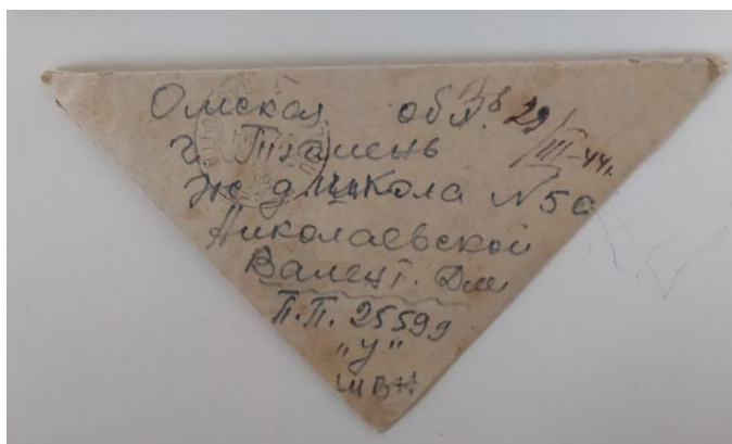
Рисунок 2 Письмо Юрия Трубецкого Николаевской В. Д.

Увидеть имени того, кто написал это письмо, нам не удалось, поэтому с невероятным интересом по буквам разбирая каждое слово, написанное размытыми чернилами или простым карандашом, нами было выяснено, что Николаевской Валентине Дмитриевне пишет с фронта ее бывший воспитанник, выпускник 50-ой школы, Юрий Трубецкой (рис. 2).