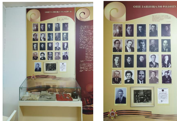
Рисунок 1 Стенды музея ГАПОУ ТО «КЦПТ»

В настоящее время в ГАПОУ ТО «Колледже цифровых и педагогических технологий» функционирует музей истории колледжа. На стендах музея (рис. 1) представлена история образования и развития колледжа.